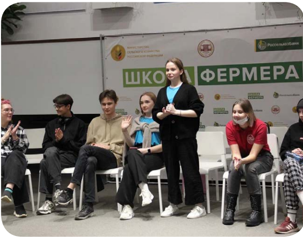
Проект «Время быть первыми»

Профсоюзный комитет первичной профсоюзной организации студентов Вятского государственного агротехнологического университета реализовал проект «Время быть первыми».