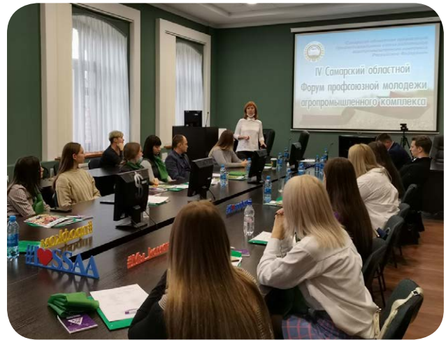
Самарский областной форум профсоюзной молодежи АПК

По итогам проекта запланированы совместные мероприятия на базе Вятского ГАТУ. Учащиеся Зуевского механико-технологического техникума приняли решение, вернувшись в ссуз, создать первичную профсоюзную организацию и после окончания техникума поступать в ВятГАТУ.